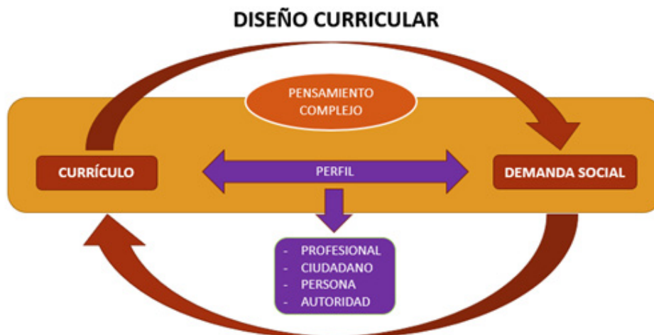
Figura 1. Componentes, relación y dinámica para la elaboración del diseño curricular por competencias basado en las propuestas de Tobón (2006), Paricio (2020) y Navas et al. (2020).

Para elaborar un buen diseño curricular, ver Figura 1, es relevante conocer los elementos, las componentes o dimensiones que configuran o definen al currículo o al plan de estudios; es decir, como está conformado, esto sirve para conocer qué elementos son dinámicos, funcionales y cuales son estructurales; también es importante asumir como principio: “cada diseño curricular es un proceso único que debe ser desarrollado, evaluado y sistematizado, en forma particular” (Toruño, 2020, p 29), recordar que todo plan de estudio responde a un momento dado de la realidad.