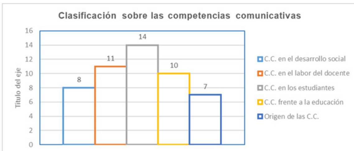
Figura 2. Clasificación de artículos sobre las competencias comunicativas.