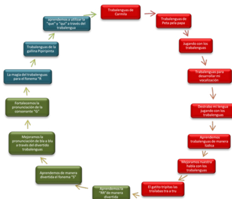
Figura 2. Distribución del grupo de talleres para el desarrollo fonológico de niños y niñas de 5 años de edad.

Los trabalenguas aplicados en los talleres pedagógicos dentro de la investigación fueron extraídos del libro que brinda el Ministerio de Educación de Perú. (PEI, 2015), Estos trabalenguas están dirigidos a niños de educación inicial, a través de la Dirección de Educación Inicial, quien pone a disposición de las docentes y niños el libro “Jugando con las palabras. Adivinanza, trabalenguas y juegos”.