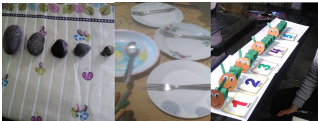
Figura 4. Uso de materiales concretos para desarrollar la noción de seriación, relación y cardinal-cantidad.